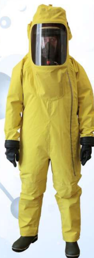
ВИТЯЗЬ ОПТИМА тип 1а ( КИХ-4Т )