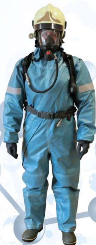
ВИТЯЗЬ СУПЕР тип 1б ( КИХ-4ЛН )