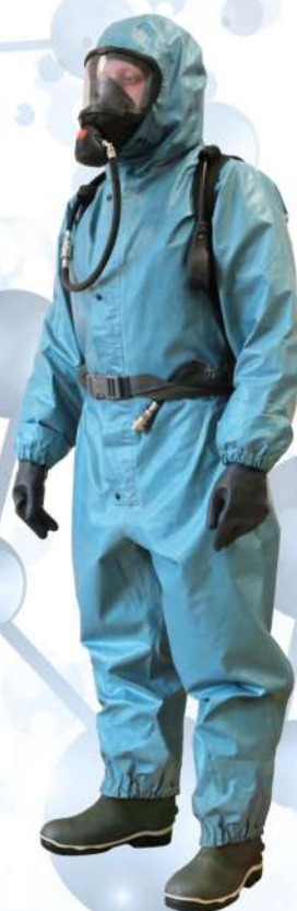
ВИТЯЗЬ СУПЕР тип 3 ( КИЗ-2 )